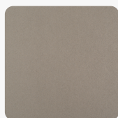
Idea FB80 ID Oberflächenstruktur Idea