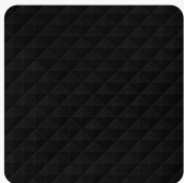
Cheope U129 CH Oberflächenstruktur Cheope