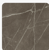
Pietra Grigia anthrazit F205 ST9 Oberflächenstruktur Smoothtouch Matt