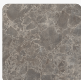
Siena Marmor grau F095 ST87 Oberflächenstruktur Mineral Ceramic