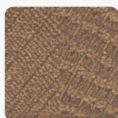
Halifax Eiche Zinn Q3176 RO