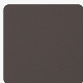
Cacao Orinoco 0749 NTM Oberflächenstruktur Nanotech Matt Material