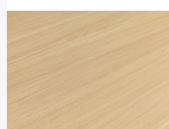
Eiche schlicht, Brettoptik Oberflächenstruktur Furnier