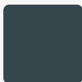
Anthrazit 1348 FH Oberflächenstruktur Feinhammerschlag