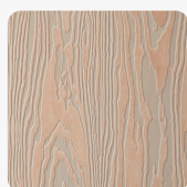
Millennium S083 ML Oberflächenstruktur Millennium