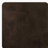
Primofiore FA33 PF Oberflächenstruktur Primofiore