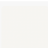
GZW Gegenzug weiß SM Oberflächenstruktur Semi Matt