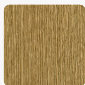
Quercia S203 QE Oberflächenstruktur Quercia