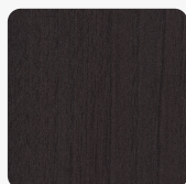
Ababo Esche anthrazit H1228 TM12 Oberflächenstruktur PerfectSense Omnipore Matt