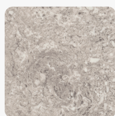
Calais Travertin F052 ST75 Oberflächenstruktur Mineral Satin