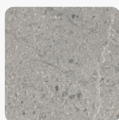
Candela Marmor hellgrau F243 ST76 Oberflächenstruktur Mineral Rough Matt