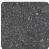
Candela Marmor anthrazit F244 ST76 Oberflächenstruktur Mineral Rough Matt