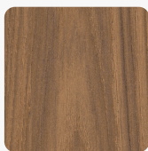
Casella Eiche braun H1386 ST40 Oberflächenstruktur Feelwood Oakgrain