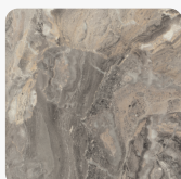
Cipollino Marmor grau F093 ST7 Oberflächenstruktur Smoothtouch Fine Pearl