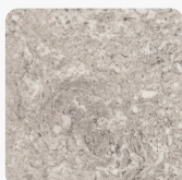
Calais Travertin F052 ST75 Oberflächenstruktur Mineral Satin