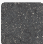
Candela Marmor anthrazit F244 ST76 Oberflächenstruktur Mineral Rough Matt