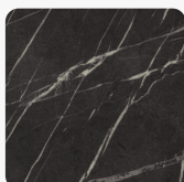
Pietra Grigia schwarz F206 PM Oberflächenstruktur PerfectSense Matt