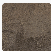
Titanit grau F227 ST78 Oberflächenstruktur Mineral Granit