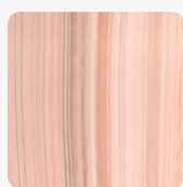
Bleached Nuwood BLW