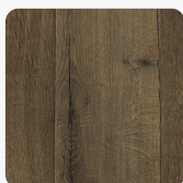
Riffian Eiche geräuchert H3149 TM37 Oberflächenstruktur Feelwood Rift Matt