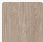
Edelkastanie grau H1760 TM28 Oberflächenstruktur Feelwood Nature Matt