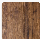
DIAMANT 2.0 Eiche Altausee Oberflächenstruktur Furnier