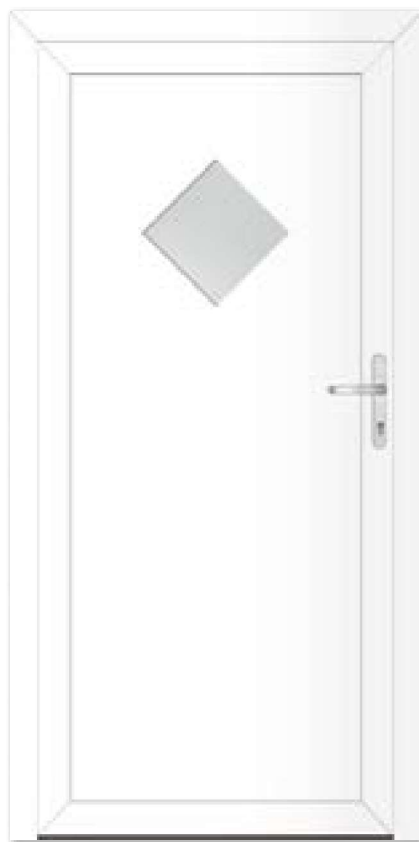
Typ 22.4400 A Basic Art. Nr. 30424/0502