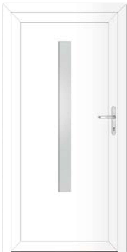
Typ 22.4500 A Basic Art. Nr. 30424/0503