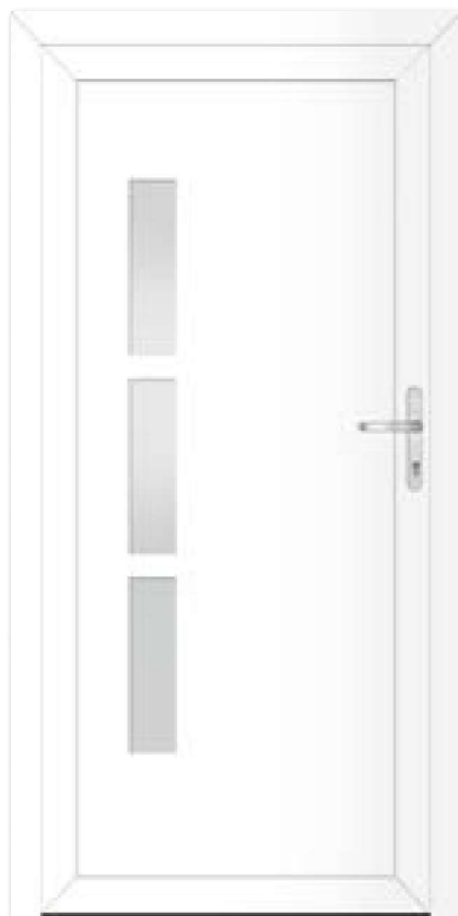
Typ 22.4600 A Basic Art. Nr. 30424/0504