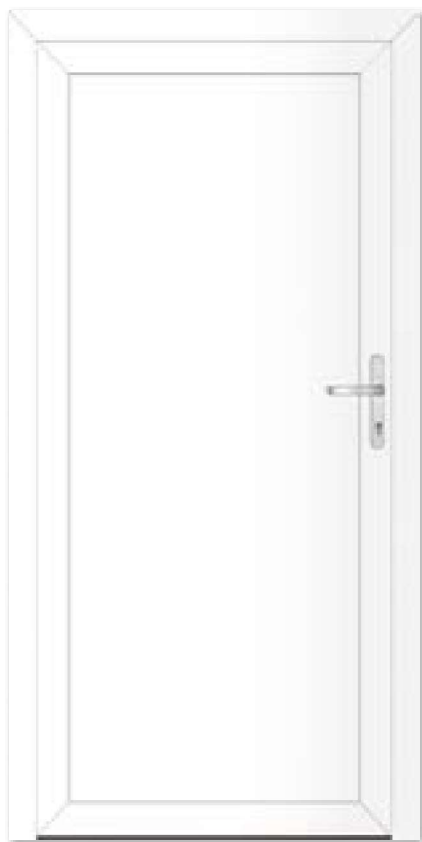
Typ 22.4300 A Basic Art. Nr. 30424/0501