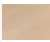
Buche gedämpft Flader, gestürzt Oberflächenstruktur Furnier