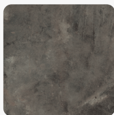
Metal Rock anthrazit F121 ST87 Oberflächenstruktur Mineral Ceramic