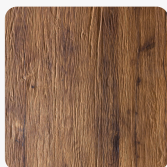
DIAMANT 2.0 Eiche Altaussee Oberflächenstruktur Furnier